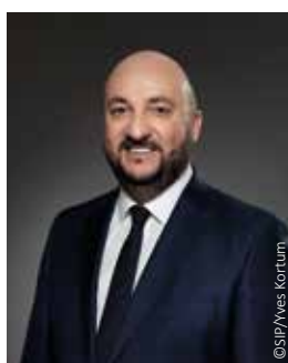
Corinne CAHEN Ministre de la Famille et de l'Intégration Ministre à la Grande Région

A handwritten signature in black ink, consisting of a stylized 'E' followed by a horizontal line.